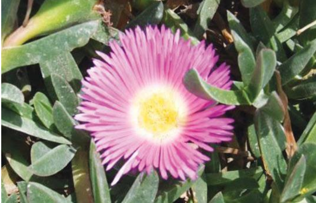
Il-pjanta tas-Swaba' tal-Madonna (ritratt ta' fuq)

Bi pjaċir ngħidu li fi Frar ta' din is-sena bi proġett approvat mill-Awtorita' tal-Ambjent u Riżorsi, il-pjanta tas-Swaba' tal-Madonna inqalgħet ħalli s-Sempreviva terġa tibda tikber. Taf għaliex qgħedt ngħidilkom hekk? Għax din il-pjanta hija rari ħafna u endemika. Issa jmiss li int u jien, insalvaw din il-pjanta billi ma nagħfgux jew naqtgħu s-Sempreviva t'Għawdex.