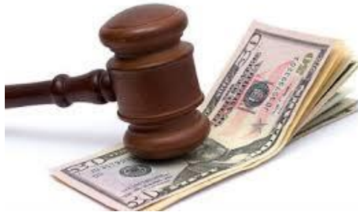
Teħel multa (ritratt ta' fuq)

Jekk trid iġġibha ma tistax anke jekk mhix bil-ligi din il-pjanta għax ma tistax titla fuq il-Ġebbla tal-Ġeneral għax teħel multa ukoll jgħifieri kieku bla ligi mid-Dwejra biss tista għgħibha din il-pjanta imma ma tistax.