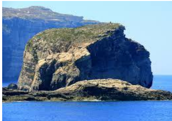
Il-Ġebbla tal-Ġeneral (ritratt ta' fuq)

Jekk trid iġġibha ma tistax anke jekk mhix bil-ligi din il-pjanta għax ma tistax titla fuq il-Ġebbla tal-Ġeneral għax teħel multa ukoll jgħifieri kieku bla ligi mid-Dwejra biss tista għgħibha din il-pjanta imma ma tistax.