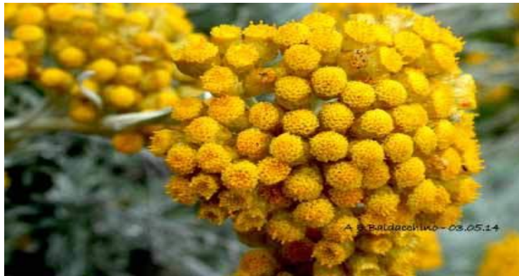
Is-Sempreviva t' Għawdex (ritratt ta' fuq)

Dan l-aħħar id-Dwejra t' Għawdex kienet f'ħafna aħbarijiet. Imma dalwaqt se nitilfu gawhra. Din insejħulha s-Sempreviva t'Għawdex. Is-Sempreviva hija pjanta sabiħa. B'din il-pjanta ilu l-bnedmin kienu jużawhom biex ifiequ. Is-Sempreviva hija zokk abjad b'fjuri sofor. Dawn jiffurmaw qisu bukket żgħir. Dawn tista ssibhom biss id-Dwejra u fuq il-Ġebbla tal-Ġeneral.